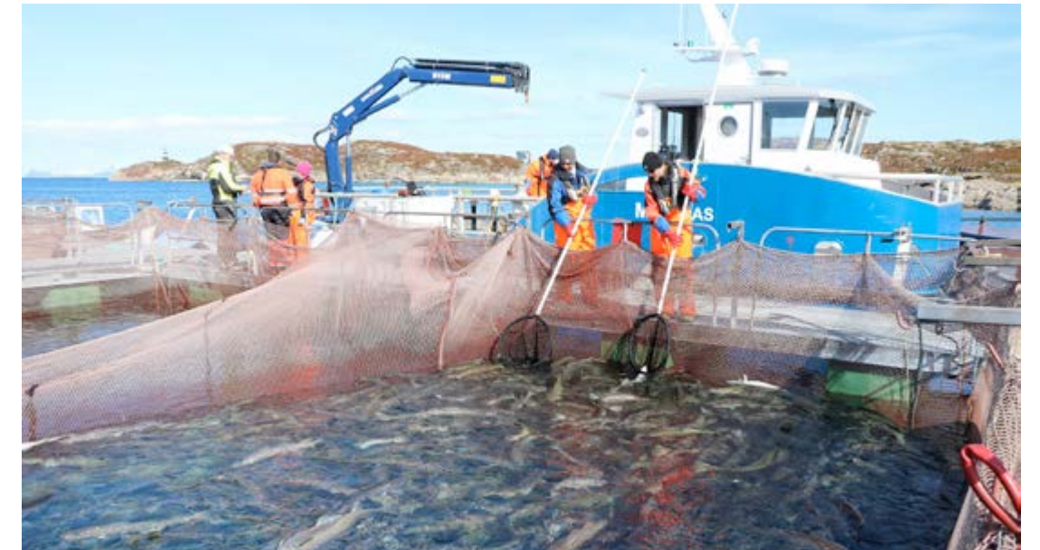
HÅVER: Her håves torsk opp til merking.

vanlig lodde. Føringperioden er på 24 uker, etter dette skal all fisken slaktes, og status gjøres opp.