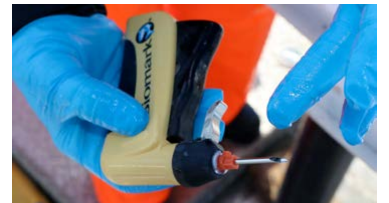
AMPULLE: Inni denne spissen av denne kanylen kan en bitte, liten glassampulle skimtes, en såkalt "Pit-tag". Kanylspissen er skradd, for å oppnå en så skånsom merking som mulig.